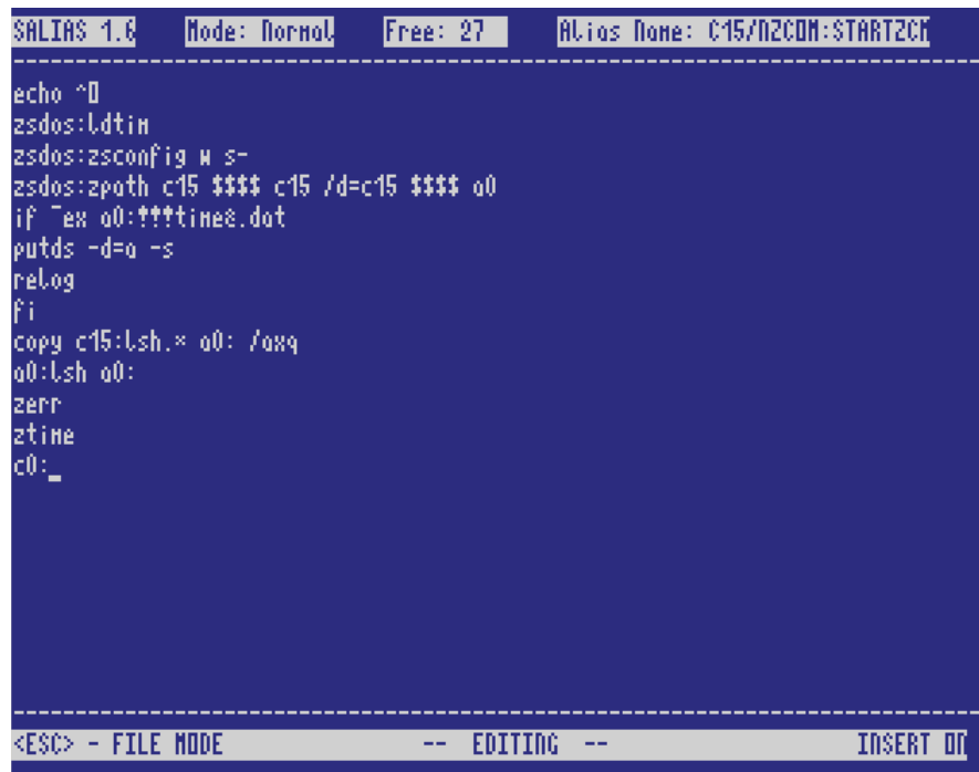
Abbildung 13: Bearbeitung von STARTZCM.COM mit SALIAS 1.6

Dann kann man die nötigen Kommandos Zeile für Zeile eintippen. Die Zeichenanzahl ist jedoch auf maximal 203 Zeichen beschränkt, was man in der oberen Bildschirmzeile verfolgen kann. Sind alle Eingaben erfolgt, wechselt man mit <ESC> in das File-Menü, speichert die Datei mit <S>ave ab und beendet SALIAS mit <X> für Exit.