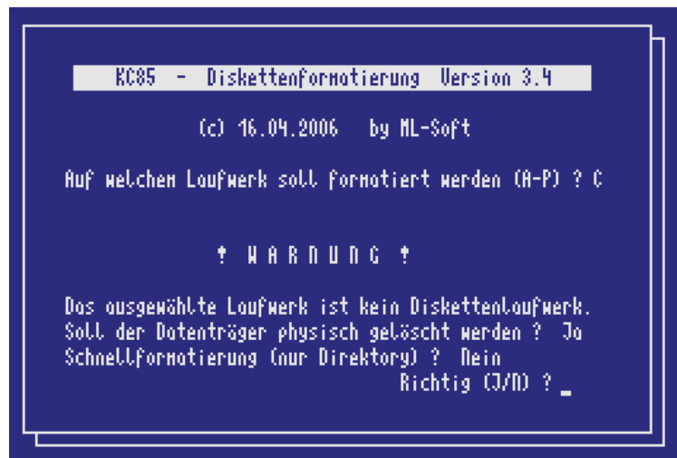
Abbildung 10: Formatierung einer Festplatte

Sind alle Laufwerke in der gewünschten Konfiguration eingerichtet, kann mit der Formatierung der neuen Festplattenpartitionen begonnen werden. Vorhandene Daten, die in einem anderen Filesystem auf der Festplatte gespeichert sind, werden hierdurch unwiederbringlich zerstört! Derartige Dateien können aber vom KC ohnehin nicht ausgelesen werden.